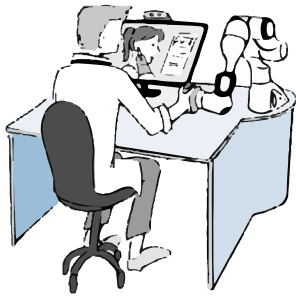
Telemedizin mit »PARTI« Digitale Sprechstunde